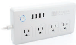
Smart Power Bar

Distributed in Canada by Gentec International gentec-intl.com