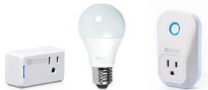
Prise intelligente mince